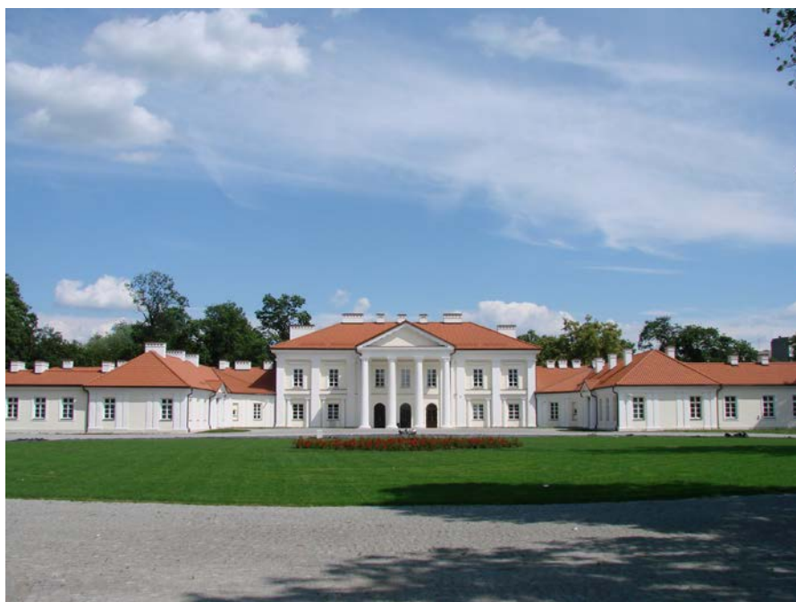
1. Pałac Czartoryskich i Ogińskich, ob. Rektorat UP-H

W trzydzieści lat od momentu lokacji Siedlce liczyły ok. 500 mieszkańców, osiągnęły powierzchnię 15 włók. Zmieniły się w ośrodek handlowo-usługowy, zamieszkiwało w nich wielu rzemieślników i kupców. W tym czasie Stara Wieś miała 12 włók osiadłych i 400 mieszkańców, wśród których dominowali rolnicy. Poziom rozwoju, jaki osiągnęły Siedlce pod koniec XVI w., pomimo kilku pożarów, przetrwał bez poważniejszych zmian do połowy XVII w., to jest do najazdu kozackiego i wojen szwedzkich.