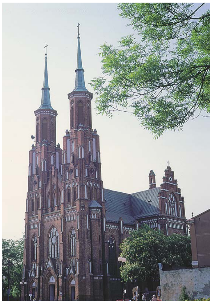
10. Kościół katedralny pw. Niepokalanego Poczęcia NMP

Początek XX wieku nie przyniósł zasadniczych zmian w urbanistyce miasta. Skoncentrowano przede wszystkim prace przy modernizacji ulic, wiele przebrukowano, a kilka poszerzono o nowe chodniki. Na ul. Stodolnej na miejscu zasypanej fosy przy dawnych wałach urządzono bulwar. W latach 1906 - 1909 ogrodzono park wysokim murywanym parkanem oraz zasypano większość kanałów i cieków wodnych. Urządzono dwa nowe skwery miejskie: jeden przy kościele na miejscu pierwszego rynku, a drugi na miejscu Rynku Końskiego pomiędzy ulicami Warszawską (obecnie Piłsudskiego) i Długą (obecnie biskupa I. Świrskiego). Miasto powiększyło się terytorialnie przez wciągnięcie w jego granice m.in. Starejwiś od lat uważanej za część Siedlec. W pierwszych latach XX wieku wniesiono w Siedlcach wiele okazałych budowli. Do najważniejszych zalicza się: Dom Ludowy z olbrzymią salą widowiskową, wybudowany w 1902 r., Szkołę Elementarną i Szkołę Rzemieślniczą zrealizowane w latach 1901 - 1903, kościół p.w. Niepokalanego Poczęcia NMP (katedra) wzniesiony w latach 1905—1912, elektrownię pochodzącą z 1906 roku, halę targową, wybudowaną w 1908 - 1909 r., a także wiele obiektów kolejowych.