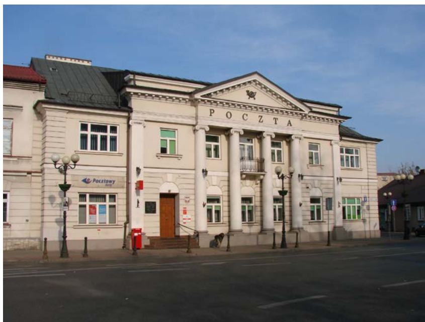
5. Budynek Poczty Polskiej

Ważnym elementem w układzie przestrzennym od 1825 roku były wały ziemne wraz z fosą, znacznie ograniczające terytorium miasta. Między innymi poza wałami znalazł się cmentarz katolicki położony przy dawnym trakcie na Węgrów (obecnie ul. Cmentarna róg Wojskowej), założony w 1799 roku. Wały nie miały znaczenia militarnego, a jedynie fiskalne, gdyż umożliwiały kontrolowanie ruchu handlowego. Miały ponad 1,5 m wysokości oraz około 4,0 m szerokości w podstawie. Po zewnętrznej stronie przebiegała fosa o głębokości ok. 1,5 m. Wały wytyczono wzdłuż ulic (nazwy obecne): Świętojańskiej, 11 Listopada, Prusa, Wiszniewskiego, Młynarskiej, Floriańskiej, 3 Maja. Usypanie wałów w pewnej mierze ograniczyło ekspansję terytorialną miasta i rozwijało się ono zasadniczo w ramach układu przestrzennego, jaki wytworzył się do końca XVIII wieku. Rozbudowa polegała przede wszystkim na zagęszczaniu istniejących kwartałów zabudowy, wznoszeniu kilkakrotnie wyższych budowli niż dotychczasowe oraz pozyskiwaniu nowych terenów w zachodniej i północnej części miasta.