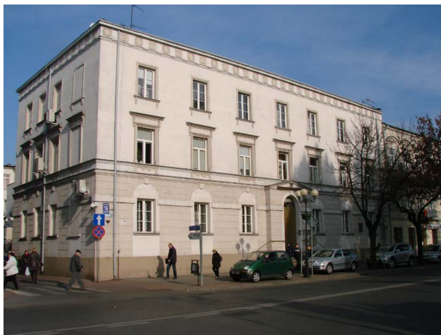
6. Trybunał Cywilny, ob. Sąd Rejonowy

Spośród okazalszych gmachów siedleckich, zrealizowanych w pierwszej połowie XIX wieku, wymienić należy: budynek poczty pochodzący z lat 1827 - 1828, szpital wojskowy wzniesiony po 1829 roku, gmach Trybunału Cywilnego, wybudowany około 1830 roku, Szpital Dobroczynności powstały około 1832 roku, Gimnazjum Gubernialne zrealizowane w latach 1841- I 844. Wiele ożywienia w rozwój Siedlec wnieśli Żydzi w większości lokujący swe domy pomiędzy ul. Węgrowską (później ul. Roźniecką, obecnie ul. Piłsudskiego) od południa a ul. Prospektową (obecnie ul. Aslanowicza) od północy. W tej dzielnicy pomiędzy ul. Węgrowską, a ul. Długą (obecnie ul. biskupa I. Świrskiego) położony był pierwszy cmentarz żydowski funkcjonujący do 1785 roku.