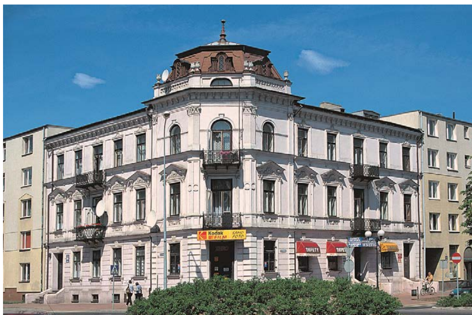
9. Kamienica przy ul. 3-Maja 44

Do roku 1869 wytyczono kolejne ulice: Nadolną, Nową oraz urządzono w pobliżu więzienia rynek bydłcy. W drugiej połowie XIX wieku miasto rozwijało się również w kierunku zachodnim. Z tego względu zaszła konieczność zamknięcia cmentarza rzymsko katolickiego z częścią prawosławną przy ul. Cmentarnej (róg obecnie Wojskowej) i utworzenie nowego, oddalonego o kilkaset metrów w kierunku północno-zachodnim (przy obecnie ul. Cmentarnej i Piaskowej).