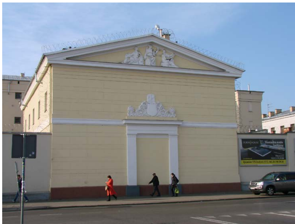
7. Sąd Komisji Poprawczej, ob. budynek więzienny

W pierwszej ćwierci XIX wieku był czynny drugi cmentarz żydowski, założony w 1785 r. na południowo-zachodnich obrzeżach miasta w pobliżu dzisiejszych ulic: Pułaskiego, Armii Krajowej i Sienkiewicza. Został on zlikwidowany w 1825 roku, a na jego miejsce wytyczono nowy daleko poza wałami miejskimi w kierunku zachodnim przy dawnym trakcie na Warszawę (obecnie ul. Szkolna).