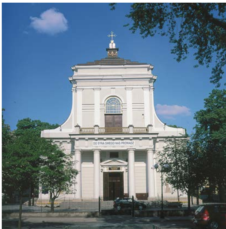
2. Kościół parafialny pw. Św. Stanisława BM

Zasadnicze zmiany w układzie urbanistycznym Siedlec zaczęły następować na przełomie XVII i XVIII wieku. Zakrojone na dużą skalę działania dotyczące przebudowy miasta podjął Kazimierz Czartoryski. Realizację tych dążeń ułatwił olbrzymi pożar w 1692 roku, w którym spłonęła większość drewnianej zabudowy miasta. W ramach porządkowania układu przestrzennego poprawiono geometrię rynku oraz wytyczono wiele nowych ulic. W zachodniej pierzei rynku wybudowano około 1693 roku pięć murowanych domów zajezdnych, a pięć lat później drewniany ratusz na środku rynku mieszczący siedzibę władz miejskich oraz sklepy. Działania te, generalnie modernizujące centrum miasta, stały się podstawą i umożliwiły późniejsze poważne realizacje budowlane, jak i planistyczne dokonane na terenie całego miasta przez następnych właścicieli.