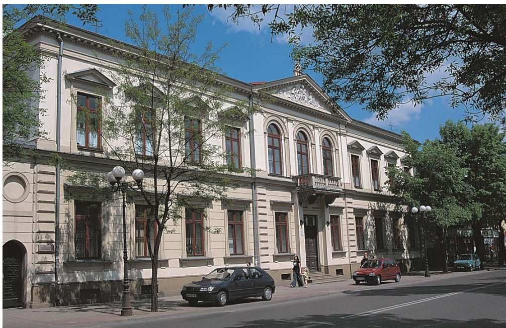
8. Gmach Towarzystwa Kredytowego Ziemskiego, ob. Kuria Diecezjalna

Pierwsze lata drugiej połowy XIX wieku nie były dla Siedlec pomyślne, charakteryzując się pewnym zahamowaniem rozwoju zarówno przestrzennego, jak i gospodarczego. Spowodowane było to m.in. likwidacją guberni siedleckiej w 1845 r. i nadaniu Siedlcom statusu miasta powiatowego w guberni lubelskiej do 1866 r. Inną przyczyną stagnacji był olbrzymi pożar miasta w 1854 roku, który strawił ok. 45% budynków. Pożoga osiągnęła tak duże rozmiary, ponieważ generalnie prawie cała zabudowa Siedlec była drewniana, tylko pojedyncze budynki najczęściej użyteczności publicznej były murowane. Kolejny pożar był w 1865 roku i zniszczył ponad 100 budynków przy ul. Pięknej, Warszawskiej i Prospektowej. Pożar ten dał podstawę sporządzenia nowej regulacji planu miasta. W planie położono nacisk na zagospodarowanie południowej części Siedlec oraz skomunikowanie miasta z dworcem kolejowym. Od lat sześćdziesiątych XIX wieku, Siedlce znów zaczęły się rozwijać, przywrócono im status miasta gubernialnego w 1867 roku, połączono linią kolejową z Warszawą i Terespołem w 1867 roku, z Małkinią w 1884, a później z Czeremchą w 1906 roku.